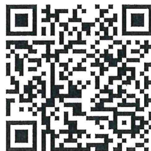
「居家藥事照護」 藥師資格申請及展延辦法